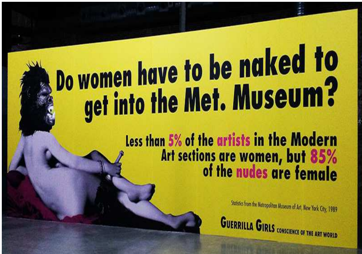
Figura 1. Guerrilla Girls, Do women have to be naked to get into the Met. Museum?