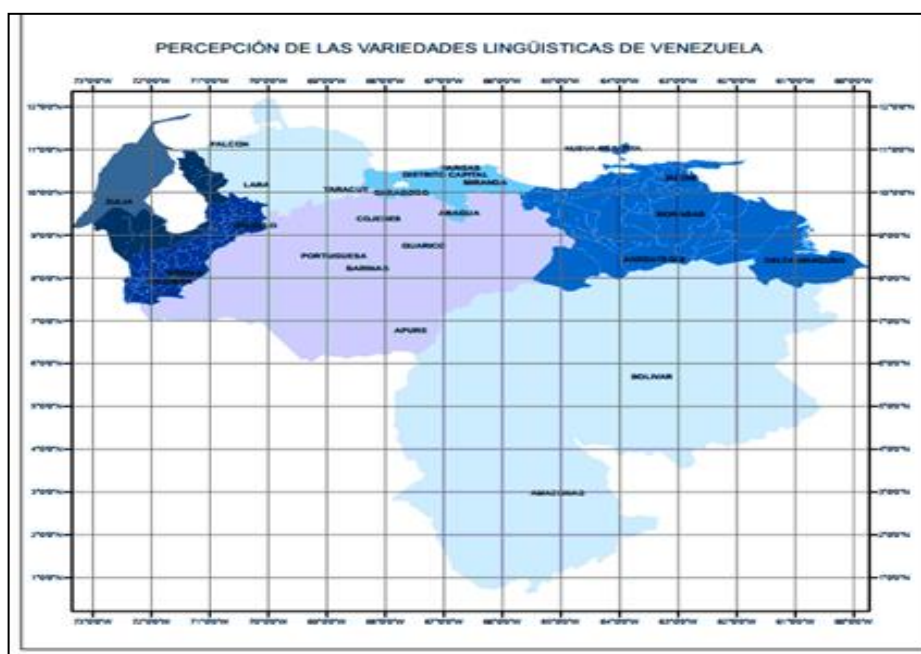
Figura 3. Mapa dialectal perceptivo del español de Venezuela

Para finalizar, hemos elaborado el mapa dialectal perceptivo del español de Venezuela. En él se muestra el continuo de percepciones mediante la gradación de la intensidad de los colores. El color azul oscuro nos señala que las zonas más percibidas se ubican al noreste y noroeste del país, esto es, la región zuliana, la región andina y la región oriental. Un azul menos intenso delimita la región central y el azul claro identifica la región de los Llanos. Finalmente, las zonas muy poco percibidas son representadas con un azul bastante claro: Lara, Falcón, Yaracuy, Bolívar y Amazonas.