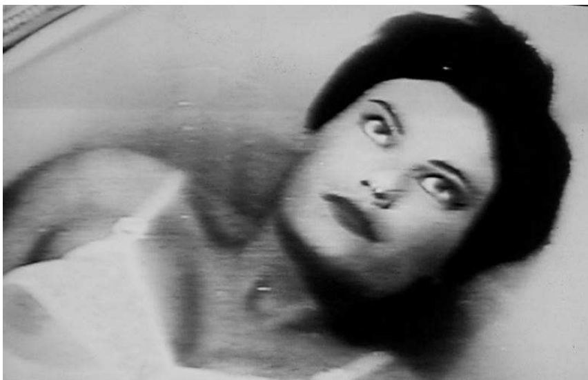
Figura 2. Foto de la presa d'apertura de Matador . Pedro Almodóvar.