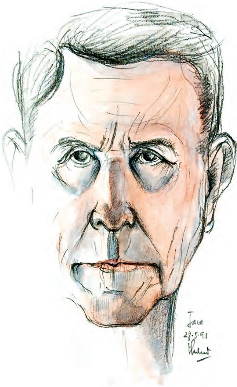
Autoretrat del 1991.