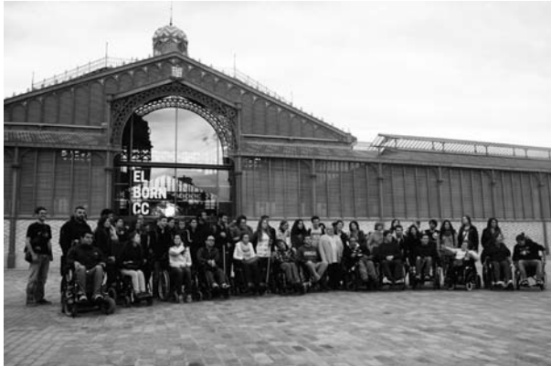
Figura 1. Participants en el projecte.

partir idees, experiències i noves eines d'innovació en l'àmbit social. Durant l'acte es van donar a conèixer de manera àgil els deu projectes d'interès desenvolupats a Catalunya darrerament. La Fundació Apip-Acam, l'Ajuntament de Barcelona i la Universitat Politècnica de Catalunya vam exposar el projecte CASBA.