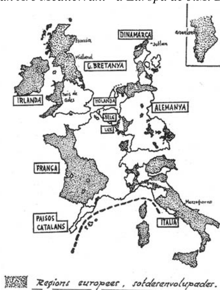
Fig.1: El «Gran Arc Mediterrani» a Europa de J.M. Batista i Roca

Mediterrani així pensat era una aposta estratègica per les regions «desenvolupades», en contraposició a les «subdesenvolupades», com ho eren les del centre d'Espanya i França, amb les quals Catalunya podia mostrar també afinitats però no calia donar-hi prioritat. L'arc mediterrani —de les regions desenvolupades— constituïa una «solució geogràficament lògica» (figura 1).