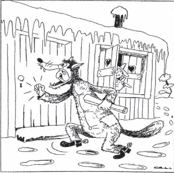
EL «LOBO FERROZ»

—¡Salid, caperúctas rojas! ¡Os traigo la «amnistía»!