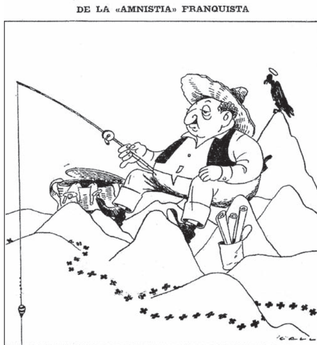
La pesca del refugiado