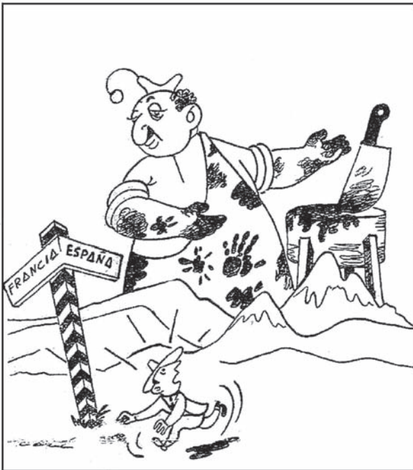
EL ABRAZO DEL OSO

—¡Mis brazos están abiertos para recibir los que tengáis las manos limpias de sangre!