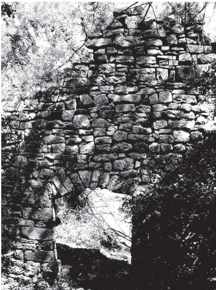
Restes de l'antic priorat benedictí de Sant Pere dels Bigats, esdevingut capella santuari del terme de Vallfogona.