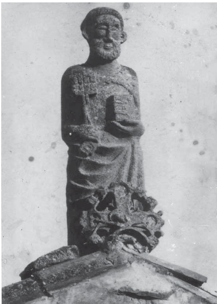
L'escultura del Sant Pere, dalt de la teulada, en una de les poques imatges històriques que se'n conserven. Fotografia anònima de principis dels anys deu del segle passat.