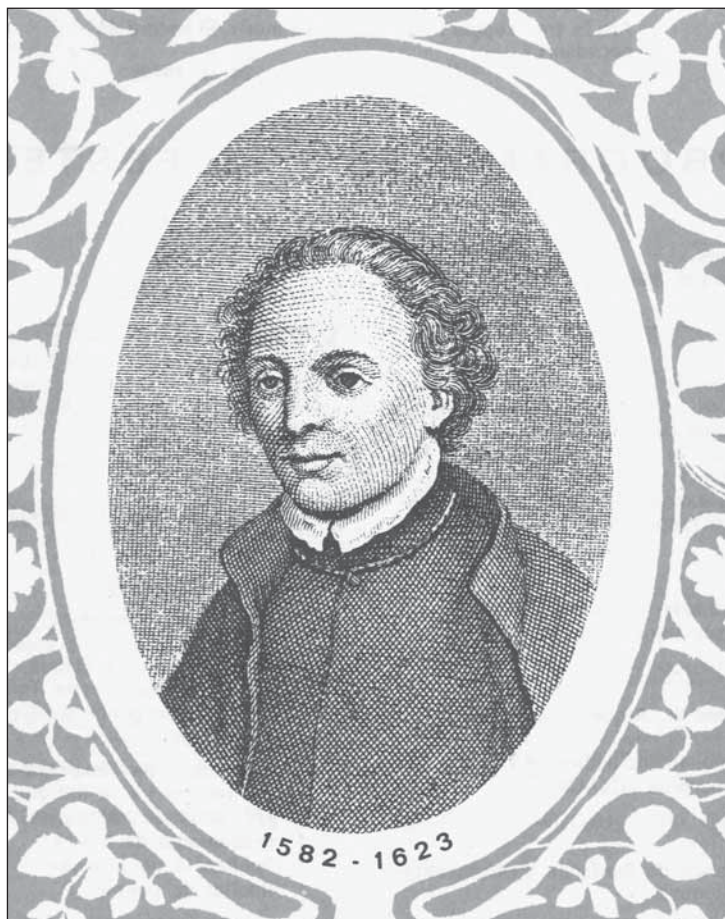
Gravat romàntic del rector de Vallfogona segons les edicions del 1840 i el 1856.