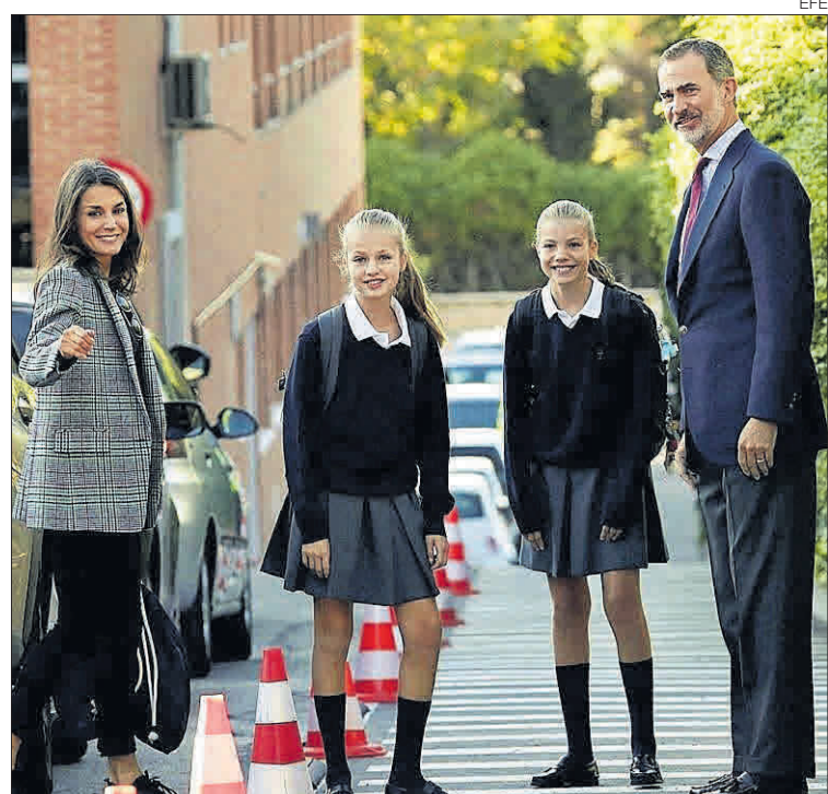
►► Elionor i Sofia, amb els seus pares, el primer dia de classe.

Els Reis van entrar amb les seves filles a l'edifici per la porta principal i, durant mitja hora, van estar a dins, on van conversar amb directius, professors i pares d'alumnes. Per a l'ocasió, Letizia va triar un look més modern i juvenil, però sobretot còmode, ja que va calçar sabatilles esportives. ≡